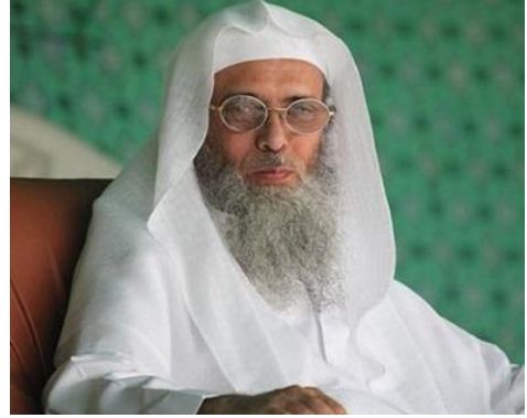
Sefer el- Havali

Bu dönemde İran devrimi ve Afgan Cihadı da Sahve'nin güçlenmesi üzerinde etkili oldu. 46 Suudi yönetimi, 60'lı ve 70'li yıllarda gençliğini ulusalcı sosyalizmden korumak için İhvan fikriyatından istifade ederken 1980'li yıllarda İran devriminin etkilerinden korumak için Sahve'den yararlandı. Sahve, Şii yayılmasından duyduğu endişeyle şiddetli bir İran karşıtlığı yapmakla kalmıyor, aynı zamanda gençlik için bir fikri zemin oluşturarak onları dış etkilerden de koruyordu. Bu çok yönlü ortam, Sahve'yi Suudi gençliği üzerinde en çok etkili olan hareket haline getirdi.