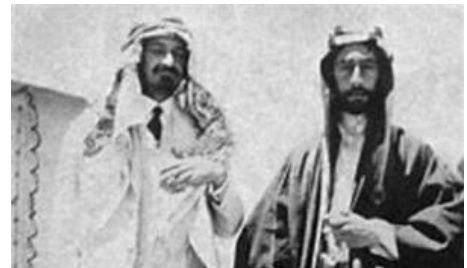
Sağ tarafta Muhammed bin Abdulvehab

Ak Parti iktidara geldiği günden günümüze kadar Suudi Arabistan'a birçok resmi ziyaret gerçekleştirilmiştir. Dönemin Cumhurbaşkanı Abdullah Gül, şimdiki Cumhurbaşkanı Recep Tayyip Erdoğan ve çeşitli bakanlıklar düzeyinde temaslar sürmüştür. Recep Tayyip Erdoğan'ın Ocak 2010 'da yapmış olduğu üç