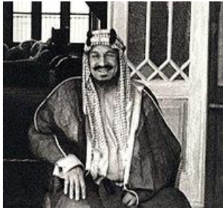
Muhammed bin Suud

Mensupları; akımı, Ehl-i sünnet dairesinde kalan bir ıslah ve dinin aslına dönmesini hedefleyen bir ihya hareketi olarak gördüğünden Muvahhidûn (ehl-i tevhîd) veya izledikleri geleneksel dinî usule göre Ehl-i hadîs ya da Selefiyye diye anılmayı tercih etmiştir. 28