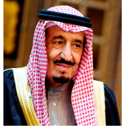
Salman bin Abdülaziz el-Suud

Suudi Arabistan’da Abdülaziz’in oğullarının kraliyet dönemi Selman’la son buluyordu, Selman hastaydı ve ölümü durumunda yerine geçecek olan Abdülaziz’in torunu Muhammed b. Nayifti. Kraliyetin yeni bir soya geçmesi anlamına gelen değişim, Trump ve Selman arasında yapılan anlaşma ve iddialara göre BAE Velihaht Prensi Muhammed b. Zayed’in ABD nezdindeki aracılığıyla farklı bir yöne sürüklenmiştir. Bin Nayif, ani bir kararla veliahtlıktan alınıp yerine Selman’ın oğlu Muhammed b. Selman getirilmiştir.