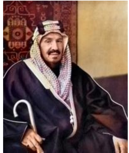
Abdülaziz bin Suud

koşullarını koymuştur. Buna karşılık Muhammed b. Abdülvehhâb, birinci koşul için "Uzat elini kanım kanınladır, yıkımım yıkımınıdır"; ikinci koşul için ise "Umulur ki Allah sana fütihatlar nasip eder de o haraçtan daha hayırlısına erişirsin" cevabını vermiştir. 5 Bu sözleşmeyle Muhammed b. Abdülvehhâb, Vehhâbiliğin siyasi liderliğini İbn Suud ailesine bırakırken onlara Vehhâbilik kimliği üzerinden Arabistan'ı ele geçirme hedefini de vermiştir. Söz konusu ittifaktan sonra İbn Suud ailesinin diğer kabileleri hâkimiyet altına alması ve Hicaz'ı ele geçirmeye çalışmasıyla Vehhâbilik, Arabistan Yarımadası'nda Osmanlı Devleti ve dolayısıyla İslam