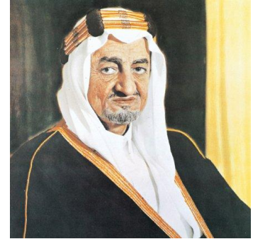
Faysal bin Abdülaziz(Kral Faysal)

Faysal'ın bu çifte kazançlı siyasetiyle, 1957'de kurulan Suudi Arabistan'ın ilk üniversitesi Riyad (daha sonra Kral Suud Üniversitesi) ve 1961 yılında kurulan Medine İslam Üniversitesi, 1970'lerde Mısır ve Suriye'den gelen İhvan üyeleriyle öğretim görevlisi kadrosuna sahip oldu. 1981'de kurulan Ümmü'l Kura Üniversitesi ise İhvan üyelerinin en etkili olduğu üniversitedir. İhvan üyeleri Suudi Arabistan'da eğitimde yapılan düzenlemelerde bizzat rol aldılar. Böylece Suudi, modern bir eğitim sistemine kavuşurken İhvan mensupları da fikirlerini, kısmen Vehhabi bir yorumla da olsa eğitim kurumlarına taşıma imkânı buldular. Bu süreç içerisinde Suudi eğitim kurumları yerli Vehhabi yaklaşım ile dışarıdan gelen İhvan yaklaşımının bulunduğu bir zemin oldu ve işte bu zemin Sahve'yi doğurdu. 45