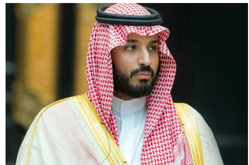
Muhammed bin Selman

Tarihi boyunca İslam dünyası aleyhinde Batı'nın yanında duran Suudi Arabistan'ın bağımsızlığının anlamsızlaşacak şekilde daha fazla Batı'ya bağlanması İslam dünyası için daha çok sorun anlamına gelecektir. ABD, Bin Selman'ın iktidarda kalma çabasına yönelik eylemlerini Türkiye'ye taşıyarak hem Suudi ve Türkiye ilişkilerini daha çok bozmayı, hem de iki ülke arasında yeni bir rekabet ortamı oluşturarak iki ülkeyi de güç durumunda bırakıp kendisi ile işbirliği içinde kalmayı sürdürmeye zorlamayı hedeflemektedir.