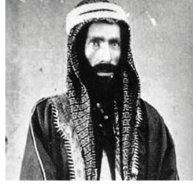
Muhammed b. Abdülvehhâb

Tarihi kaynaklar; adına "Krallık" veya "Emirlik" denilen kronolojik olarak üç Suudi devletinin varlığından bahsederler. Bunlar; I. Suudi Krallığı/Emirliği, II. Suudi Krallığı/Emirliği ve günümüzdeki mevcut Suudi Arabistan Krallığı'dır.