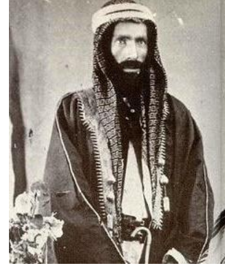
Muhammed bin Abdülvehhab

Muhammed bin Abdülvehhab'a ( ö.1206/1792) dayandırılan ve adını Muhammed bin Abdülvehhâb'a nisbetle almış siyasi-dini bir akımdır. Ortaya çıktığı mukaddes toprakları göz önünde bulundurduğumuzda, İslam dünyasını doğrudan etkileyen geniş bir yönünün olduğunu anlayabiliriz.