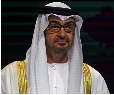
Muhammed bin Zayed

kendisi ile ilgili eleştirilerini sonlandıramamıştır. Nitekim ABD'nin "2017 İnsan Hakları Uygulamaları Ülke Raporları"nda Suudi Arabistan, kişi hakları, kadın hakları, ifade özgürlüğü, işkence, yargısız infaz, dini hakların kısıtlanması gibi pek çok konuda sertçe eleştirilmiştir. Aynı eleştiriler CRS(Common Reporting Standards/Ortak Raporlama Standardı)'nin 21 Eylül 2018'de yayımladığı raporda da yer almıştır.