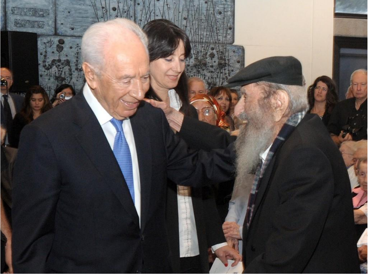
Şekil 2. Şimon Peres ve İsrail'de yaşayan bir Kürt.

Siyonist medyanın, İsrail'in en yakın istila hedefi olan Arap Yarımadası'nın bazı mikro topluluklar dışında Arapça konuşmayan tek toplumu olan Kürtlere ise özel bir ilgisi söz konusudur. Özellikle Irak Kürdistan'ı bağlamında siyonist Yahudilerin Kürtlere yönelik farklı bir ilgisi göze çarpmaktadır. 10 Bu yöndeki yaklaşımlar, İsrail ve Irak Kürtlerinin “Ortadoğu”nun dönüştürülmesinde birlikte rol üstlenebilecekleri gibi bir boyuta dahi ulaştırılmıştır. 11 Bu yöndeki söylemin hız kesmeyerek son yıllarda Yahudilerle Kürtler arasında soydaşlık kurma boyutuna varması, İsrail'in Kürt konusu üzerinde ne kadar durduğunu göstermesi açısından dikkat çekicidir.